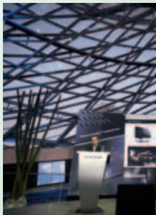
Harman-Kardon wählte die BMW-Welt in München als Location.

Evolution“ lautete das Motto, unter dem die Münchener BMW-Welt zum Schauplatz einer hochwertigen Harman Kardon-Produkt- und Marken-Inszenierung wurde. Plötzlich Musik, das Licht dunkelte ab, ein Laserstrahl schien einen Riss in die Wand zu fräsen, „schob“ sie nach unten und gab den Weg zur Ausstellung der neuen Produktgeneration frei. Lasertunnel und Saxophonklänge zogen die Gäste in den Saal, wo Lichtinszenierungen die verschiedenen Produktgruppen in Szene setzten. Auf weiße Gazen wurden wie Lichttexturen Kernaussagen der Marke projiziert. Im Anschluss an die Produktpräsentation erlebten die Zuschauer ein Dinner mit Show-Programm. Als Höhepunkt der Performance präsentierte sich eine Entertainment-Lösung: Tänzer kamen aus dem Nichts auf die Bühne, während Laser einen überdimensionalen Designriss der neuen Systeme visualisierten. Das Laserbild drehte sich,