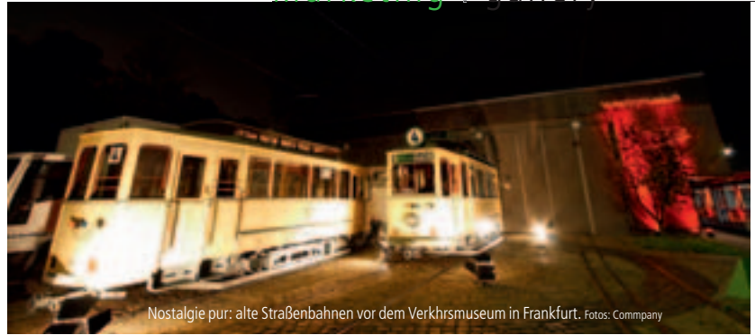
Nostalgie pur: alte Straßenbahnen vor dem Verkehrsmuseum in Frankfurt.